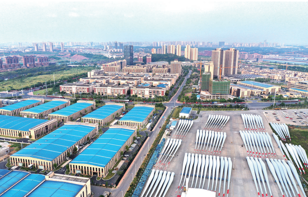
2021年9月8日,株洲·中国动力谷自主创新园。近年,株洲充分发挥轨道交通、航空、汽车三大产业优势,打造先进制造业的研发、生产、孵化的产业集聚区,中国动力谷已成为株洲推进高端制造业发展、打造制造强市、实现产业报国的重要抓手。

前进!湖南工信系统将永葆“闯”的精神、“创”的劲头、“干”的作风,奏响创新实干强省,朝着目标踔厉奋发!