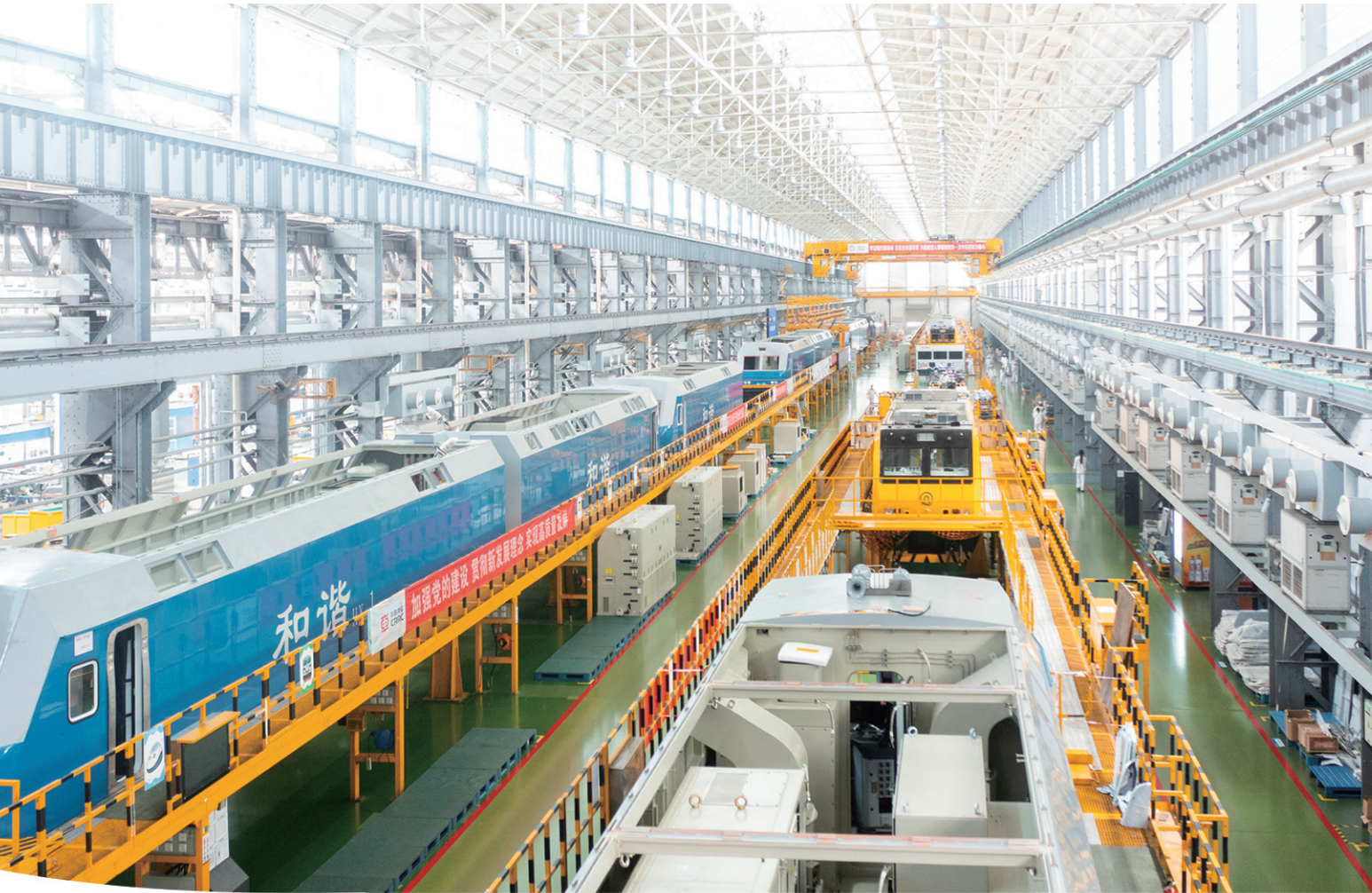
2021年9月7日,中车株洲电力机车有限公司机车事业部总成车间,生产线上如火如荼。株机先后研制出“中国第一台电力机车”“中国第一台交流传动电力机车”“世界功率最大的电力机车”等诸多“第一”。中国电力机车产业在这里实现了“从普载到重载、从常速到高速、从直流到交流、从引进到出口”的四大历史性跨越,从“追赶者”变为了“领跑者”。

省工信厅充分发挥牵头、服务作用,每年集中70%以上的制造强省专项资金支持产业链发展,搭建产业对接平台,持续补链强链,本地配套和协作水平进一步提升。