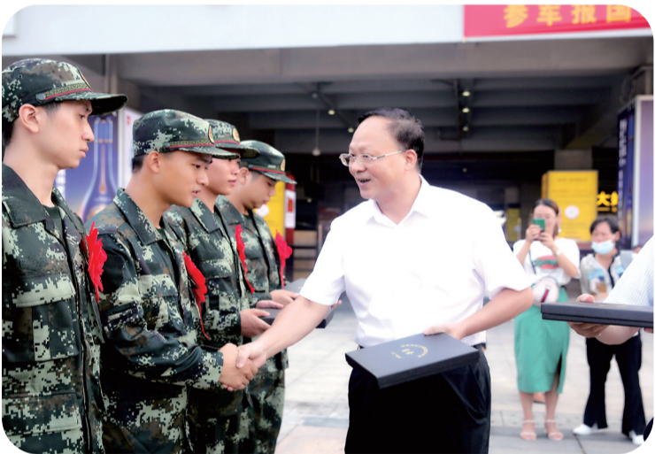
湖南财经工业职业技术学院主要领导欢送新兵入伍。

从花草树木到亭台楼阁,从嚶嚶鸟鸣到雕塑铭石,湖南财工职院处处彰显着环境之美。如果问该院学生,最喜欢学院的什么地方?他们会告诉你很多的答案:“景观步道”“图文信息中心”“行知广场”…… 美,在湖南财工职院不仅体现在校园的环境上,更以“以美育人”的形式存在。 “环境对人之影响如春风化雨。在教育领域,环境对受教育者的身心发展有着重要影响,人若被动地接受环境影响,环境就对人表现出较强的客观影响作用;人若主动地利用与优化环境,并注重开发环境功能,就可以驾驭环境,让环境为人类服务。因此,我们在打造校园文化、规划校园建筑物时,充分挖