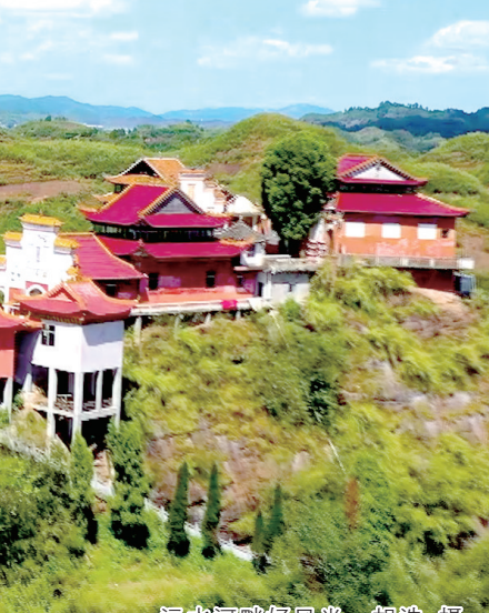
沅水河畔好风光。

启动了河岸“增绿护源”三年行动。全市共建成国家级湿地公园8处，先后有6条(段)河流获评全省美丽河湖。