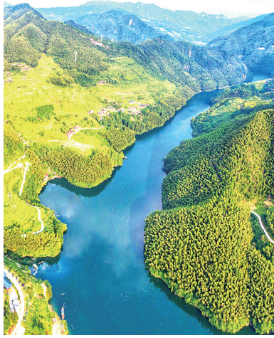
怀化市公溪河深渡苗族乡段。