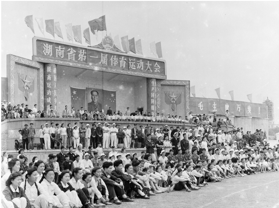
1959年5月3日至11日,省体育场,湖南省第一届体育运动大会举行。图为开幕现场(资料照片)。