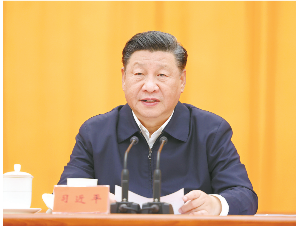
10月13日至14日,中央人大工作会议在北京召开。中共中央总书记、国家主席、中央军委主席习近平出席会议并发表重要讲话。

习近平指出,当今世界正经历百年未有之大变局,制度竞争是综合国力竞争的重要方面,制度优势是一个国家赢得战略主动的重要优势。历史和现实都表明,制度稳则国家稳,制度强则国家强。我们要毫不动摇坚持、与时俱进完善人民代表大会制度,加强和改进新时代人大工作。