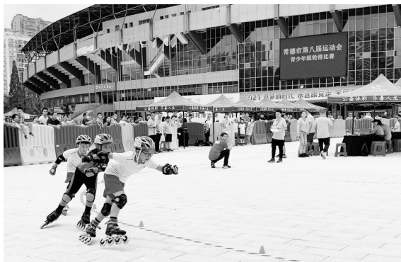
常德市第八届运动会比赛现场。

9月15日下午，常德市体育公园篮球馆，随着成年组男子篮球冠军争夺战结束的哨声响起，历时3个多月的常德市第八届运动会圆满落下帷幕。 颁奖仪式上，武陵区以151.5枚金牌数、总分3913获得区县(市)代表团青少年金牌排名第一和总分排名第一；武陵区、鼎城区、市国资委、市公安局、市政府办分别获得区县(市)、“五区”代表团、市直单位及中央、省驻常德单位成年组总分金奖；桃源县等9个区县(市)及单位获得优秀赛区奖，澧县等14个区县及单位获优秀组织奖；武陵区等10个区县及单位获得体育道德风尚奖。 本届运动会共有来自市直、中央和省驻常德单位、全市各区县(市)及“五区”16个代表团参赛，参与的运动员、教练员、领队、裁判员及工作人员超5000人。赛事分为青少年组和成人组，共有30个竞技项目。