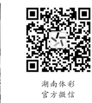
湖南体彩官方微信

于民，用之于民”为发行宗旨，致力于建设“负责任、可信赖、高质量发展的国家公益彩票”，持续打造温暖有光的微公益平台，汇聚万千购彩者的公益爱心，筹集公益金用于社会公益事业和体育事业的发展。从补充全国社保基金，到为社区捐赠体育器材、助力全民健身活动开展，体彩公益金已经悄然进入大家生活的方方面面。(张智超)