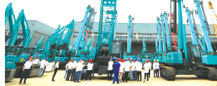
近日,山河智能SWCC1000E桁架臂履带起重机和SWTC400E伸缩臂履带起重机同时下线,这两款新一代E系列起重机的成功下线,标志着山河智能在起重机研发方面又取得了新的突破。

目前,中联智慧产业城第一台中大挖掘机下线,三一智联重卡1号厂房交付使用,三安半导体即将试投产,湖南能源大数据智慧平台上线。长沙作为领头雁打造的标志性工程,对湘潭、株洲将产生巨大的辐射作用,成为三市共享的资源。