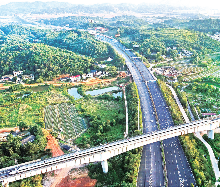
长株潭“绿心”区。今年以来,长株潭三市产业协同有了国家战略作为背景和支撑。