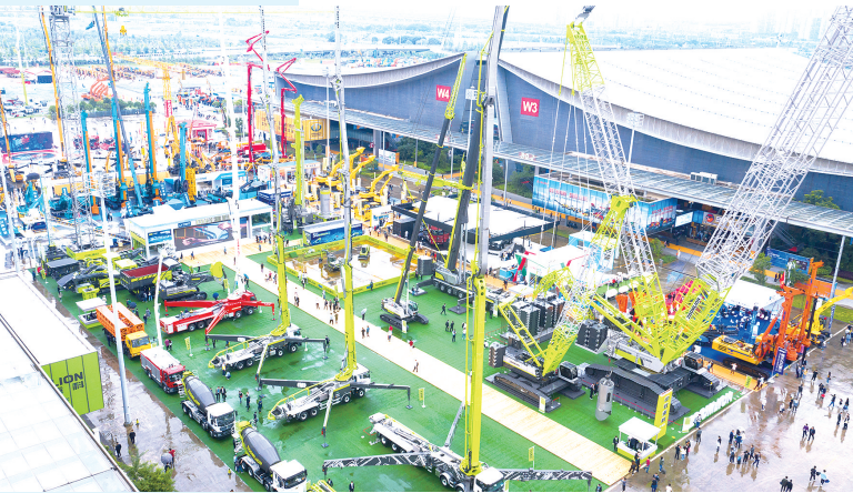
2021长沙国际工程机械展览会。

三一与达索系统联合开发制造管理系统(MOM)项目,将在5座“灯塔工厂”和重卡新工厂率先试行。