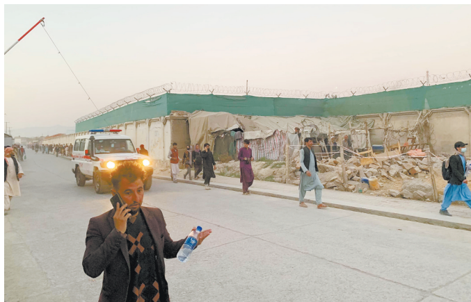
喀布尔机场外遭恐袭

教育部联合国家卫健委日前印发《高等学校、中小学校和托幼机构新冠肺炎疫情防控技术方案(第四版)》,按照“从严从紧”原则,对学校人员返校要求、校门管理、员工管理、应急处置机制等防控措施进行了调整。方案要求学校掌握师生返校前14天的健康状况和行程信息,高校师生员工返校前要提供48小时内核酸检测阴性证明,返校后按照当地防控要求可再分批进行核酸检测。