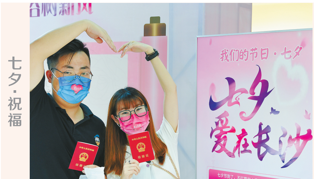
上图 8月13日，长沙市天心区政务大厅婚姻登记办理处，新婚夫妻戴着“爱在长沙”字样的口罩合影。当天，天心区开展“我们的节日·七夕”活动。

着力防控地方金融风险。统筹好发展和安全两件大事，聚焦政府性债务风险、涉众型金融风险等领域，实现对所有地方金融活动监管全覆盖。