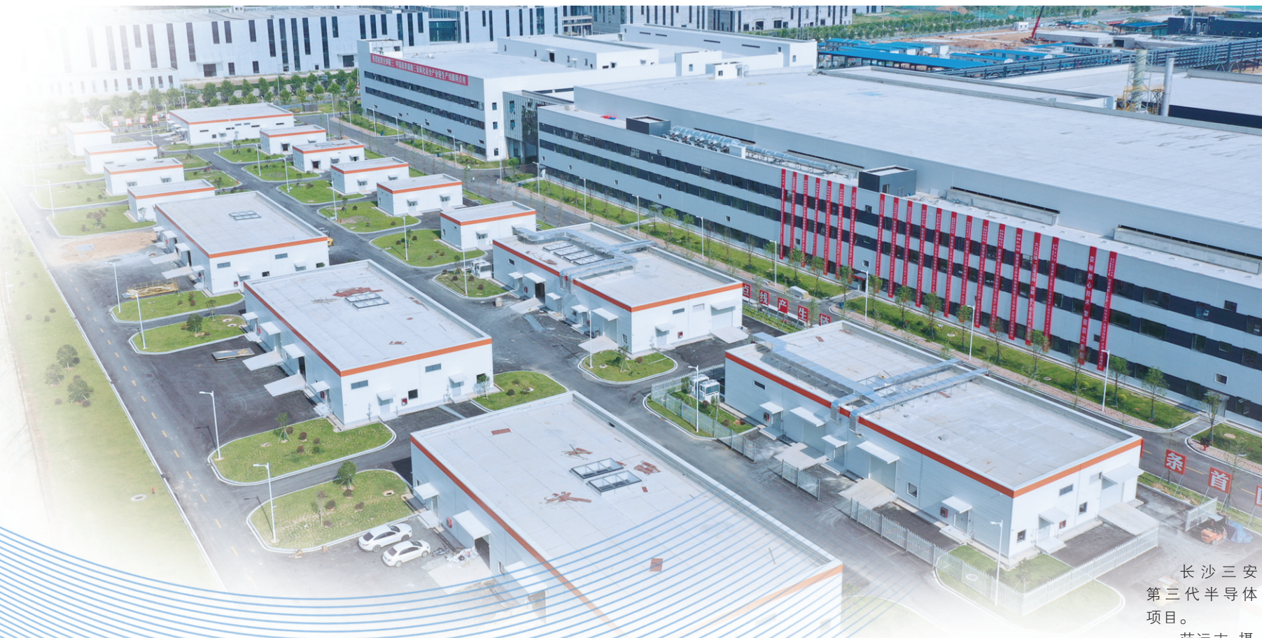
长沙三安第三代半导体项目。

“要突出抓项目、固根本，进一步稳定制造业基本盘；要围绕优势产业加大全产业链招商和支柱产业、骨干企业联系服务力度；要着重发展战略性新兴产业，超前谋划布局，为长沙高质量发展积蓄新动能！”省委常委、长沙市委书记吴桂英在7月19日召开的中共长沙市第十三届委员会第十四次全体会议上，对局势判断十分清晰。