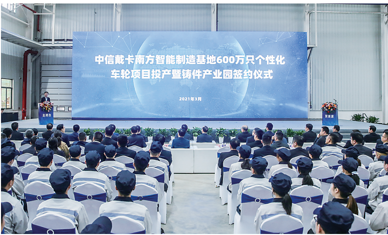
中信戴卡南方智能制造基地600万只个性化车轮项目投产。