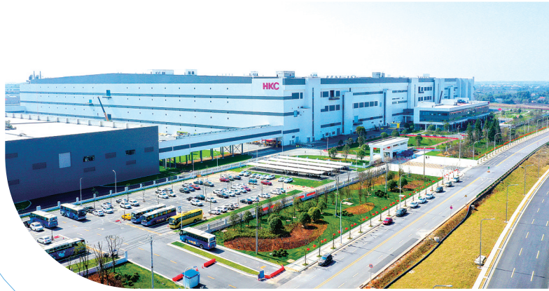
长沙惠科第8.6代超高清新型显示器件生产线项目。