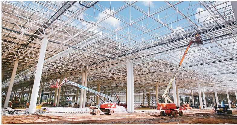
三一智联重卡扩产项目。

同时，长沙坚持以“三智一芯”产业为主攻方向，全力建设功率芯片产业基地，从龙头企业的引进到上下游配套企业竞相“开花结果”，先后引进湖南三安、中电科48所(楚傲半导体)、景嘉微、国科微等一批行业领军企业，在麓谷范围内已聚集长沙54%的功率芯片企业，初步构建形成了集芯片设计、材料、装备制造、工艺设计、封装封测等环节于一体的产业链条。