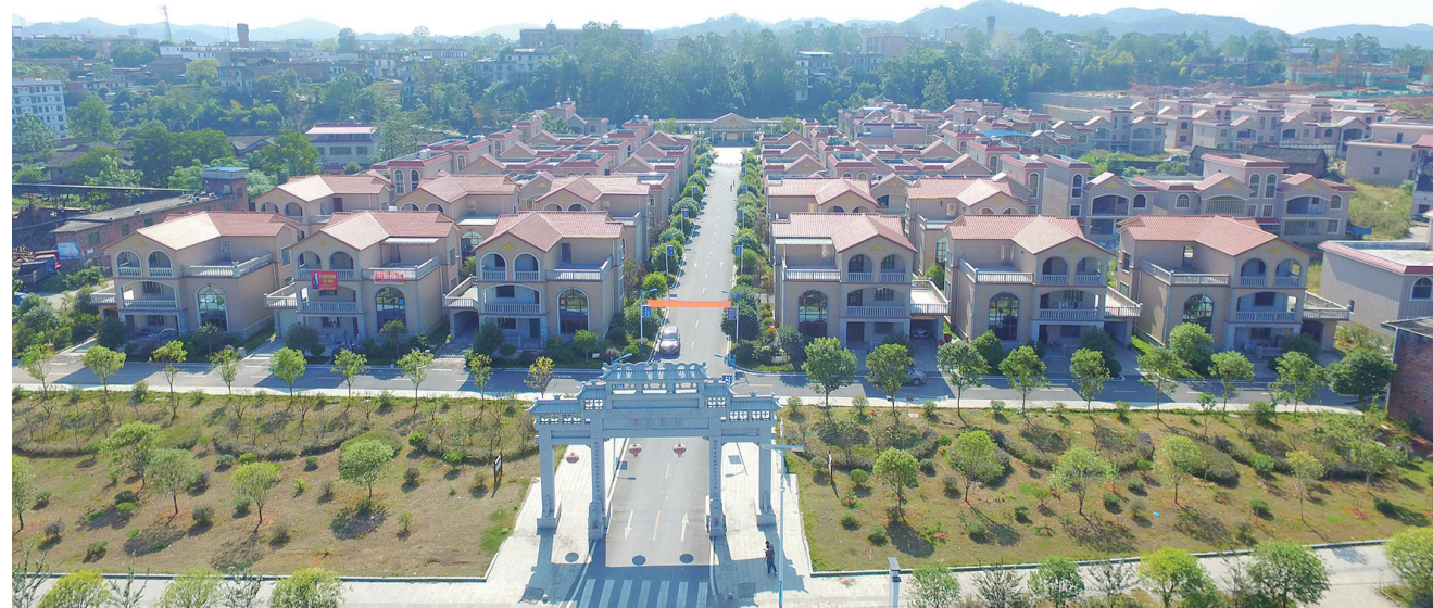
湘赣边区的郴州市宜章县梅田镇车头村。

桂东县委负责人表示,他们根据湘赣边区域合作示范区建设总体目标和工作任务,主动作为,积极组团,敢于示范,目前正全力争取国家、省里的政策,在各类专项规划、政策、项目、改革试点示范等方面得到国家、部委、省有关厅、局更多指导和支持。