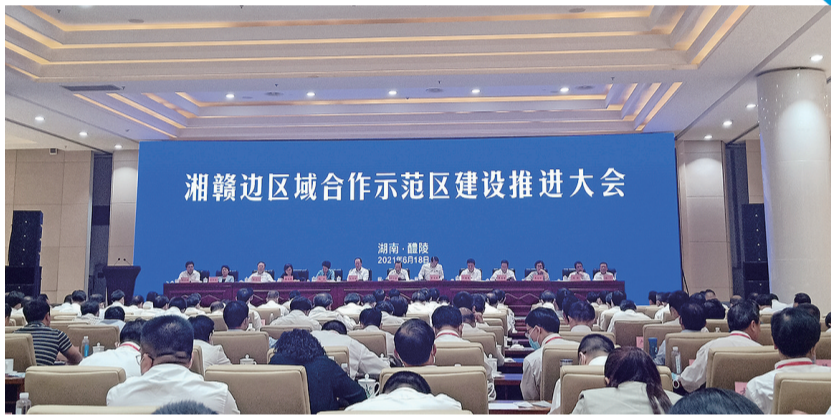
6月18日,湘赣边区域合作示范区建设推进大会召开。

为此,郴州市成立了高规格湘赣边区域合作示范区建设工作专班,由市委副书记任专职组长,5名市级领导任副组长。专班下设“一办八组”。专班办公室和工作小组配备了专门人