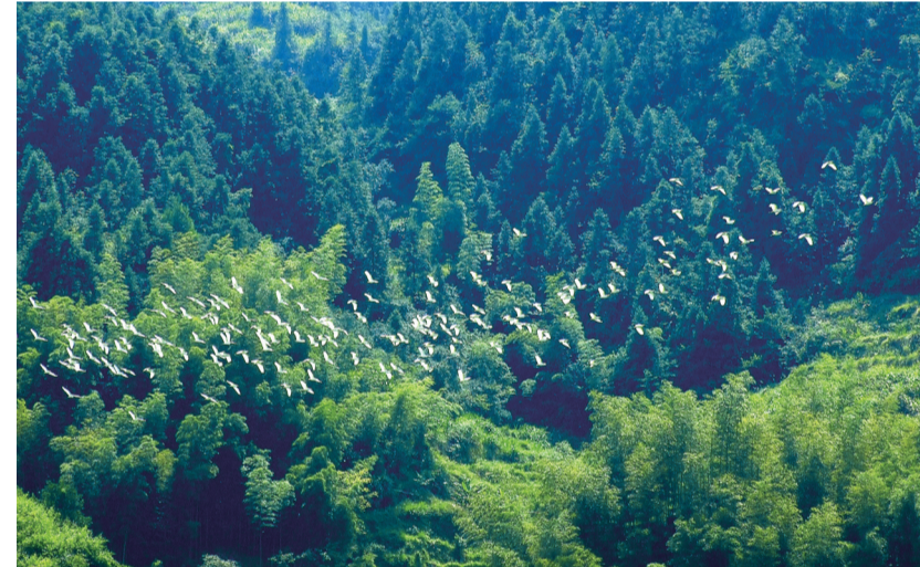
汝城、桂东、遂川候鸟保护联防联控迁徙通道。

跨湖南、江西、广西3省、自治区的区域大通道,建成通车后,将促进湘赣边区沿线矿产、水、森林、农产品、劳动力资源开发利用,为区域经济发展和产业布局拓展更大空间,使郴州市沿线212万余人口直接受益。