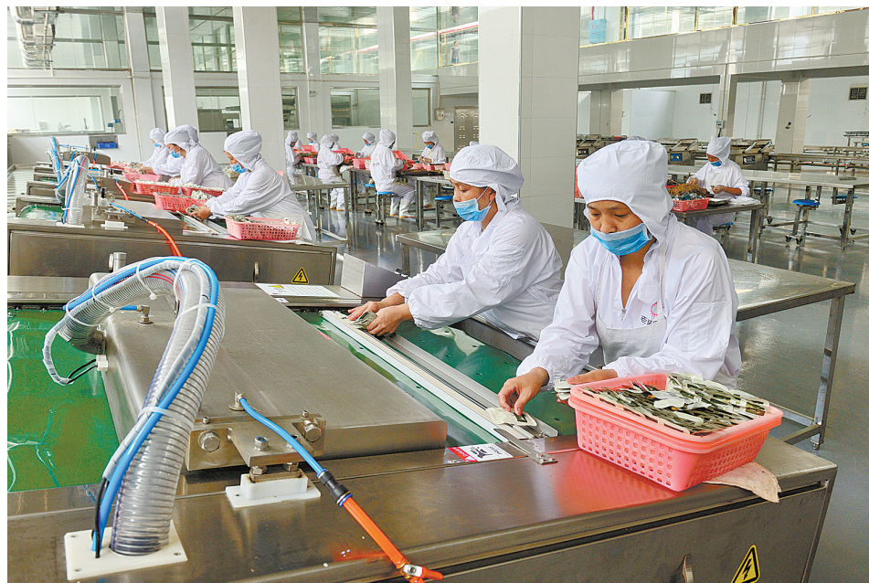
新晃老蔡食品有限责任公司牛肉加工车间。