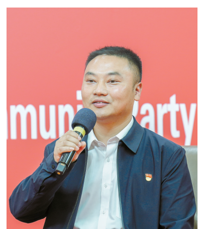
龙兵作为新发展党员代表参加交流。