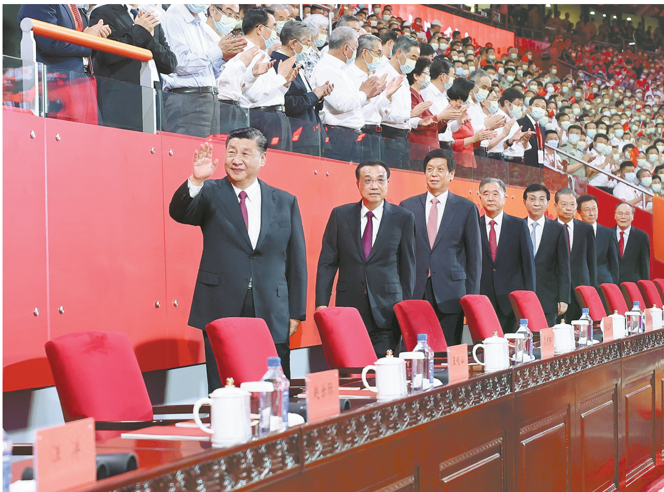
6月28日晚，庆祝中国共产党成立100周年文艺演出《伟大征程》在国家体育场盛大举行。习近平、李克强、栗战书、汪洋、王沪宁、赵乐际、韩正、王岐山等党和国家领导人，同约2万名观众一起观看演出。

第二篇章“风雨无阻”以舞蹈《开国大典》开篇，回顾热朝天的社会主义革命和建设年代。在震耳欲聋的炮声中，情景合唱与舞蹈《战旗美如画》呈现抗美援朝的激烈场面，讴歌志愿军战士保家卫国的炽热情怀。在慷慨激昂的唱腔中，戏曲与舞蹈