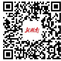
《意见》全文请扫新湖南二二维码

生活,提高社会文明程度,传承弘扬中华优秀传统文化、革命文化、社会主义先进文化。践行绿水青山就是金山银山理念,打造美丽宜居的生活环境,高水平建设美丽浙江,全面推进生产生活方式绿色转型。坚持和发展新时代“枫桥经验”,构建舒心安心放心的社会环境,要以数字化改革提升治理效能,全面建设法治浙江、平安浙江。