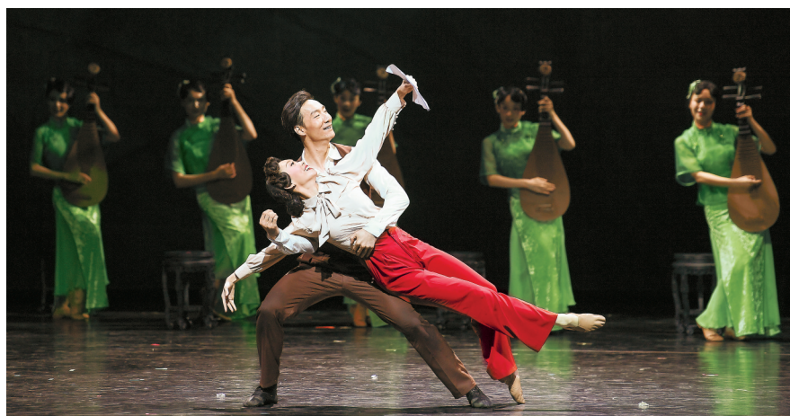
5月6日晚,红色题材民族舞剧《热血当歌》在湖南大剧院举行全省巡回演出首演。

变、“一·二八”事变等使他快速成长;聂耳起初是稚嫩的学生,阳光又纯真,在亲历了国家危亡的困境、见证了人民的种种苦难后,成长为新中国新音乐的开路先锋和反法西斯勇士。