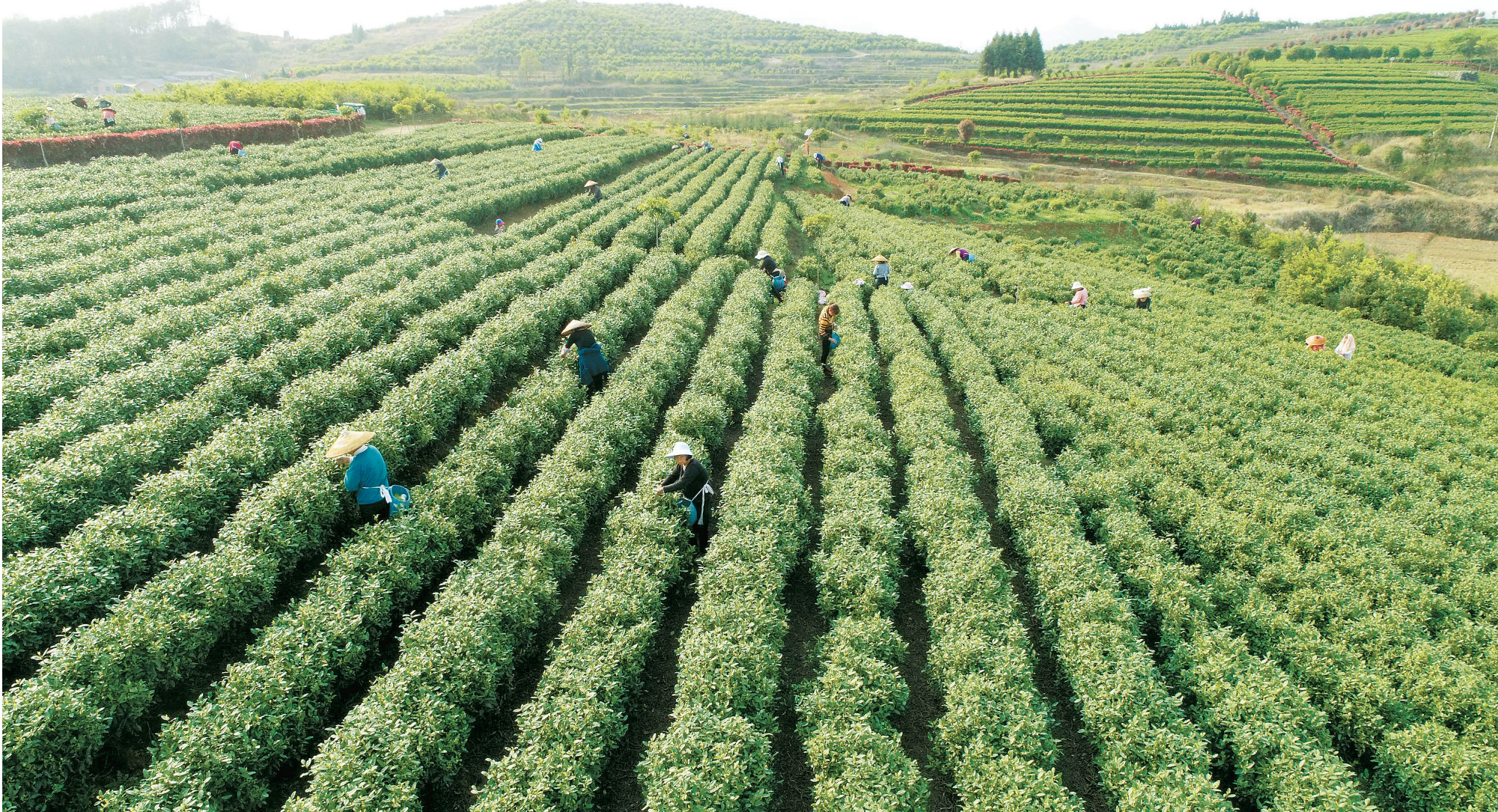
3月25日,涟源市桥头河镇湘浙茶叶种植专业合作社,茶农在采摘茶叶。

新起点承载新希望,新蓝图开启新征程。涟源将大力弘扬伟大脱贫攻坚精神,咬定青山不放松,一年接着一年干,奋力绘就乡村振兴壮美画卷。