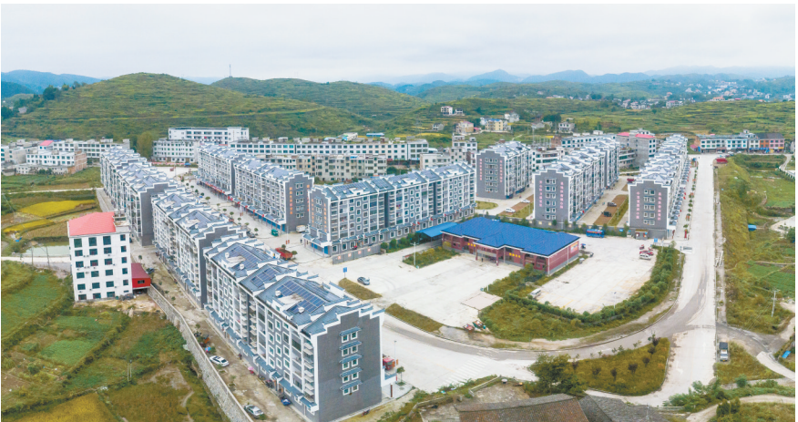
古塘乡易地扶贫搬迁集中安置点。

一件接着一件干,一张蓝图绘到底。涟源将在巩固拓展脱贫攻坚成果同乡村振兴有效衔接上发力,做到全面小康路上不落一人,书写新时代“涟源样本”。