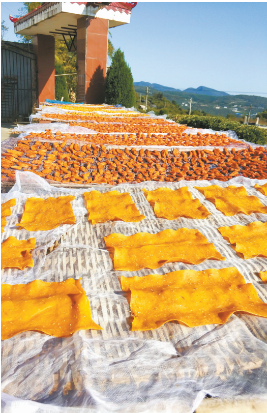
伏口镇胡家坪村,村民家里晒制的纯手工红薯干。