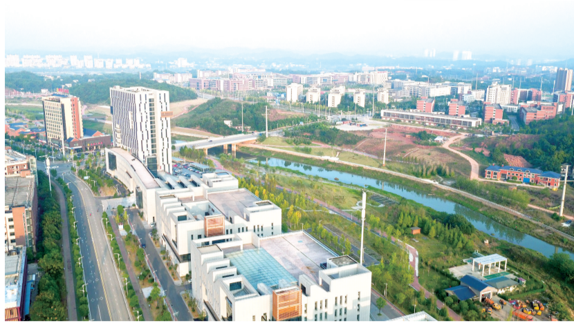
株洲职教园