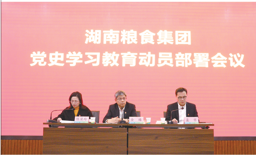
湖南粮食集团党史学习教育动员部署会议现场。