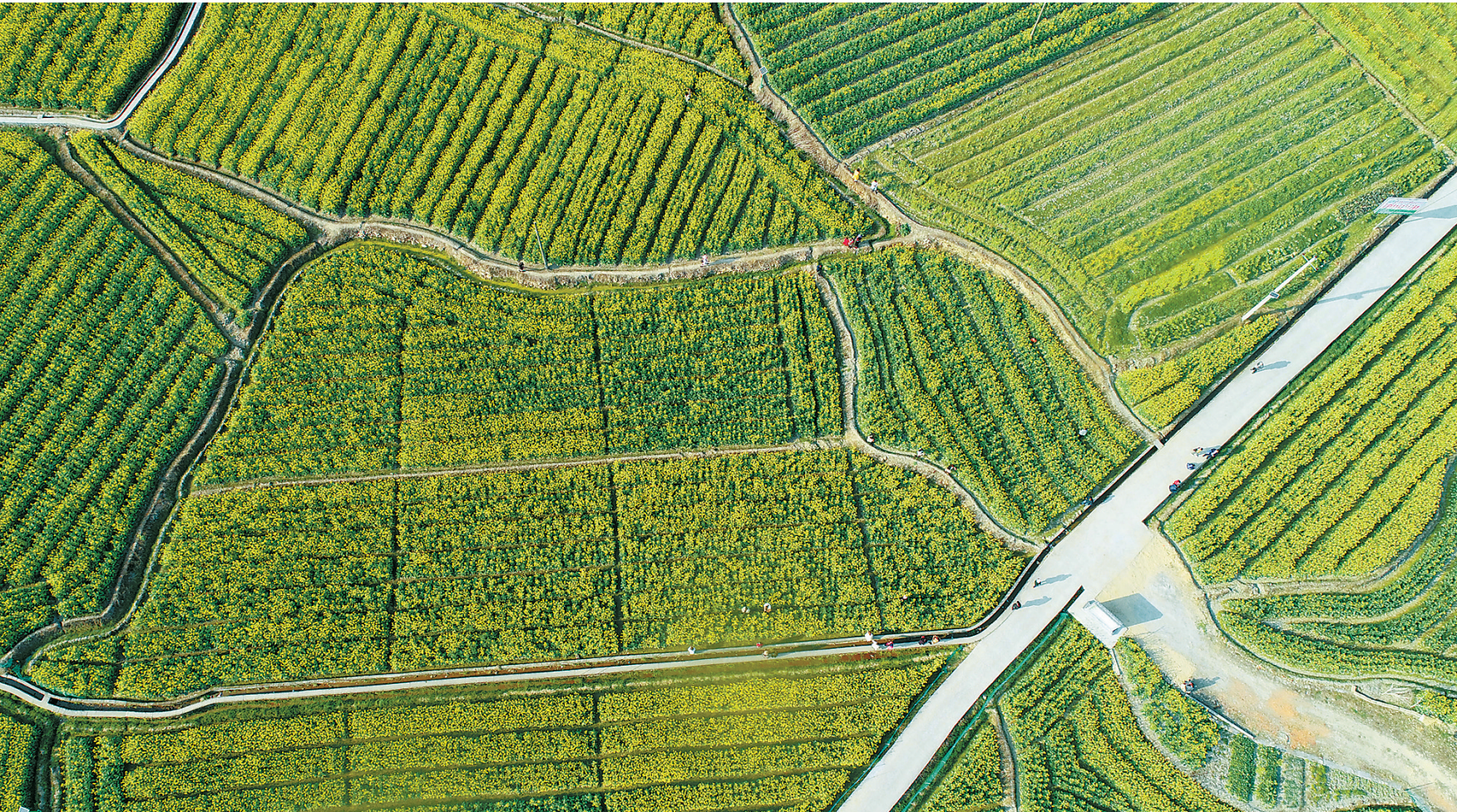
满目金黄香百里 2月22日,桂东县大塘镇全溪村油菜花绽放,吸引了众多游人前来观赏。去年,该县通过“以奖代投”的方式鼓励村民利用冬闲土地种植油菜3.61万亩,让“冬闲田”变成“增收田”。

县电商逆势增长。该县去年建成集产品展示、企业孵化、运营、培训、新媒体销售于一体的县级电商公共服务中心1个;优化村级供销、电商综合服务站点305个;坚持以销定产,大力推广“合作社+基地+农户+互联网”经营模式,去年电商交易额达到99.86亿元,累计带动创业就业10万人,农产品销售达10亿元。 近年来,城步抢抓商务部定点扶贫机遇,推动电子商务与传统产业对接,为打赢脱贫攻坚战添砖加瓦。2016年至2019年,该县连续4年在全省电商扶贫考核中被评为优秀,成功创建全国电子商务进农村综合示范县。去年,该县电商交易额突破5.5亿元,累计带动创业就业1.5万人,带动脱贫3500人。