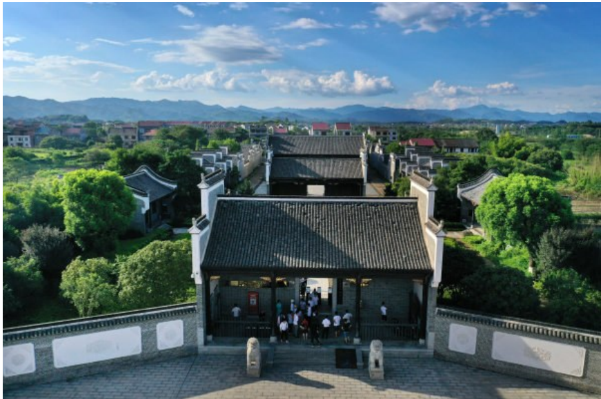
茶陵县工农兵政府旧址纪念馆。