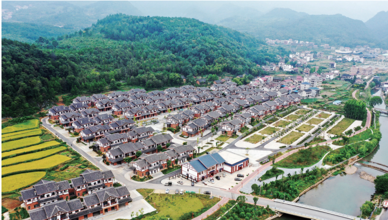
2019年9月19日，环境优美的新邵县严塘镇白水洞村易地扶贫搬迁集中安置点。

白水洞村易地扶贫搬迁的普遍性意义是什么？两天的走访调查和思考后，记者想到的关键词是“长远”。 正是因为眼光放得长远，集中安置点在选址、规划和房屋设计上均体现出了科学性、合理性。靠近景区，就靠近了人气、产业和市场；腾出一层楼用作商业开发，就腾出了无数致富的可能性和发展空间。选址选对了，“地基”铺好了，精准的产业规划和发展就会水到渠成。 正是因为眼光放得长远，脱贫攻坚和乡村振兴才能有效衔接。脱贫攻坚是圆满的终点，更是全新的起点。只有眼光放长远了，方向才能保持一致，终点时积蓄的能量，在新的起点才能形成更强大、更持久的推动力。 在乡村振兴的新征途上，眼光同样要放长远，幸福才长久。