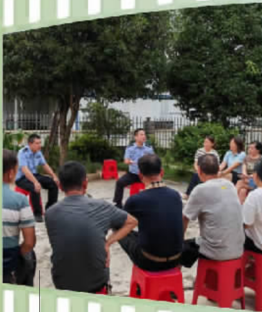
民警组织召开“屋场会”宣讲防电诈知识。