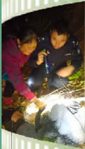
民警夜间找寻在山林中迷路的老人。