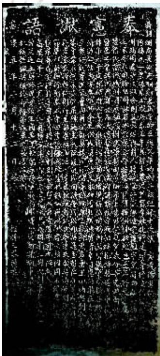
“奉宪谕语”古碑完整拓片。