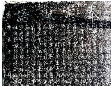
“奉宪谕语”古碑局部。