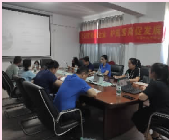
律师向企业员工讲解与企业生存息息相关的法律条文。

此次宣讲干货满满,企业管理层及员工均表示收获颇丰。下一步,石鼓区司法局将继续落实“千所联千企”活动号召,进一步深化中小微企业法律服务工作,打造最佳法治化营商环境。