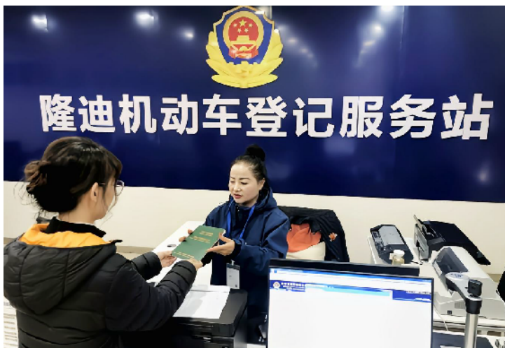
机动车登记服务站快速为车主办理上牌。

近年来，常德公安交警部门以进一步优化营商环境为抓手，扎实开展“十佳”科室创建活动，为民办实事活动，“清廉”窗口创建活动。为此，常德交警支队车管所依托设立在汽车销售企业的协助办理指定机动车专门机构——机动车登记服务站等多个载体，提供一站式服务、延伸服务等多项服务举措，让群众尽量少跑路，让企业增效益。市民在机动车登记服务站，从购车到上牌，只需半个小时，就能拿到登记证书、行驶证、临时号牌等上路许可手续。这种一条龙服务措施，既方便群众