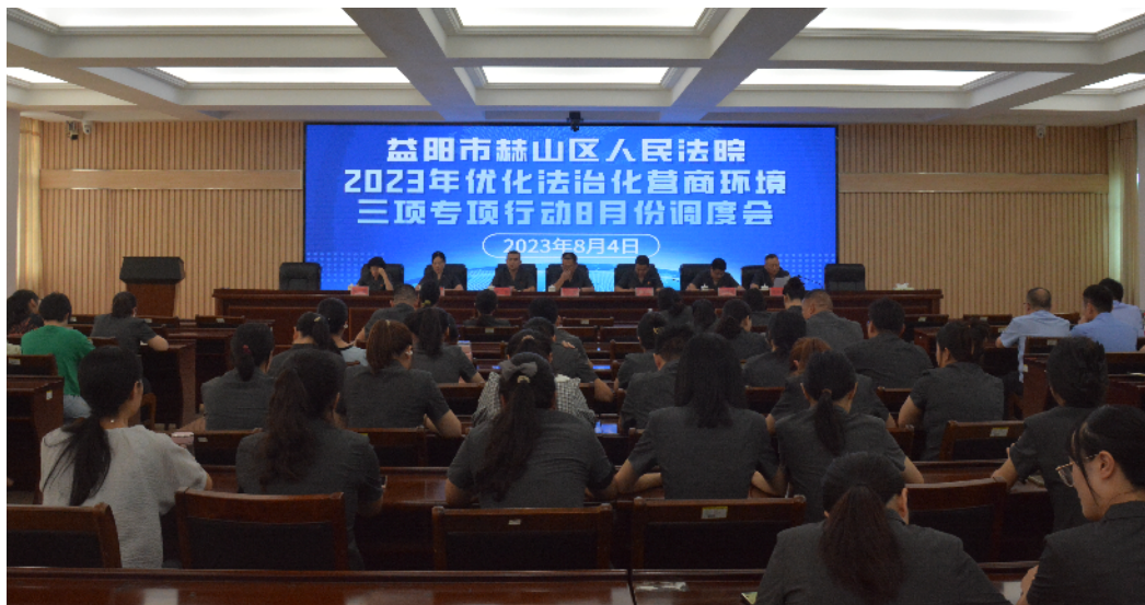
赫山区法院组织召开优化法治化营商环境工作调度会。

加强组织领导。院党组高度重视,协调推进,成立专项行动领导小组,制定《优化营商环境三项专项行动工作方案》,多次召开党组会、院务会及全院干警会议进行部署、调度;强化部门联动。各庭室局队设置专职联络员,抽调精干力量组建办案专班,强化团结协作,凝聚攻坚合力;压实主体责任。紧盯考核指标,分阶段稳步推进,强化督办落实,每月召开由院长、分管院长、庭室局队负责人和联络员参加的专题调度会议。