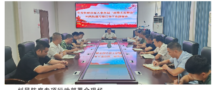
纠风反腐专项行动部署会现场。