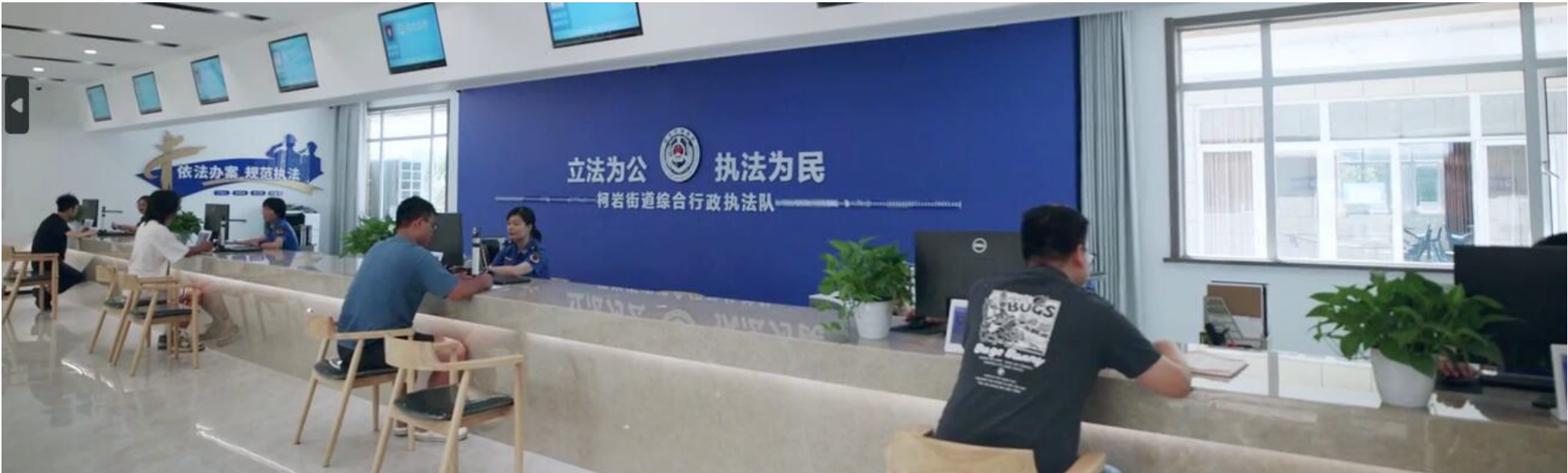
柯岩街道一站式办案中心。

市域社会治理，一头连着经济社会发展，一头连着人民群众幸福指数。4月11日，“市域社会治理现代化·全国媒体浙江行”正式启动。全国各地近30家新闻媒体的记者奔赴杭州、宁波、嘉兴、绍兴、金华等地，本报记者通过实地走访、沉浸式体验，立体化、多方位展现市域社会治理现代化的浙江探索。