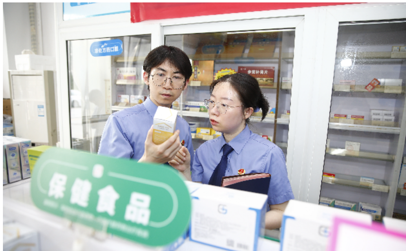
检察官查看保健食品包装宣传情况。