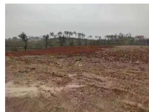
工业污泥被清理处置。

本报讯(通讯员 王亚唐佳君)“检察官,最近好多外地车辆在我们这里来来往往,还在空地倒了垃圾,可能会污染环境,请求你们调查。”日前,永州市冷水滩区检察院在接到伊塘镇某村居民的举报线索,立即深入现场开展调查核实。