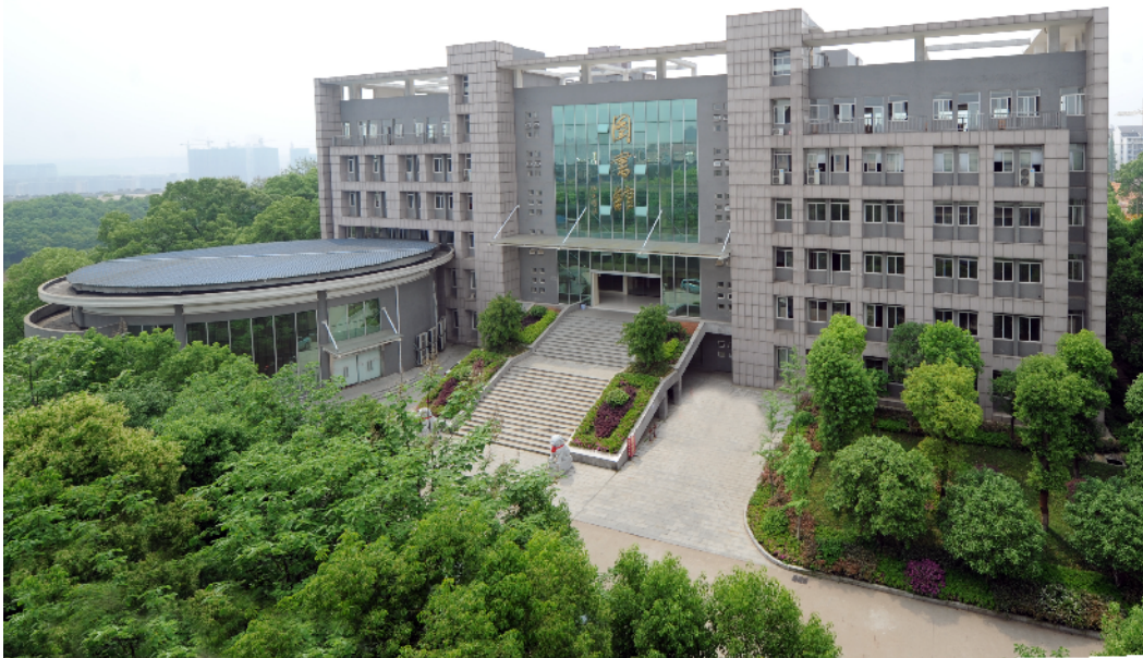
长沙环境保护职业技术学院图书馆。