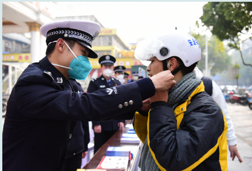
怀化市公安局交警支队民警向群众免费发放安全头盔。

本报讯(通讯员 罗明媚 宋健)1月10日,怀化市公安局民警在太平桥佳慧华盛堂开展“110宣传日”活动。活动围绕“矢志不渝110,新征程上保安宁”这一主题,大力宣传110在打击犯罪、灾害救援、应急处突和服务群众方面的先进事迹,教育引导广大人民群众了解110、理解110、支持110,警民联手共同促进110的发展。