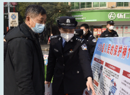
会同县民警向群众宣传110服务和报警知识。

在活动现场,民警通过向市民发放宣传资料和宣传礼品的形式,解答市民提出的疑问,以当前多发频发的网络诈骗案件为重点进行宣传,使对诈骗的防范知识家喻户晓,着力提高群众自我保护自救的能力。民警还讲解酒驾、醉驾、骑行电动车不戴安全头盔等各类交通违法行为的危害性及处罚规定,结合工作中的典型道路交通违法及伤亡事故案例,详