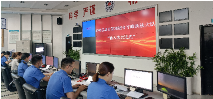
石峰区城市管理综合行政执法大队组织开展输入法比武。

近年来，株洲市石峰区城市管理和综合执法局在科学化、精细化、智能化上下功夫，推动城市管理手段、管理模式、管理理念创新，让城市运转更聪明、更智慧。 队伍建设迈出新步伐。组织开展“大学习、大交流、大练兵、大比武”活动，通过学习《行政处罚法》等法律法规、执法人员行为规范和着装管理等内容，开展业务知识考试，让城管队员学法、懂法、用法。进行“轮岗交流”“门店座谈”等活动，邀请门店代表与路段城管队员、中队长等面对面，了解门店实际需求，实现管理与被管理者之间的双向互动。同时，利用周六早上一小时进行大练兵，以军事训练科目为基础，兼顾趣味性与团队性，集竞技、娱乐、健身等综合于一体，使队员的身体素质、精神面貌、组织纪律得到明显进步与提高。 民生服务取得新提升。持续开展门店诚信等级评价活动。通过对沿街商户等管理主体建立数据入库、等级评价、上