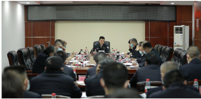
益阳市副市长、市公安局局长史尚篪出席会议并讲话。

会议要求,开展“冬春攻势”专项行动是市公安局党委紧扣全市社会治安实际情况,紧抓考核薄弱环节,结合岁末年初工作特点所部署开展的行动。全市公安机关要立足主责主业,全警参与、全力以赴,深入推进严打整治“冬春攻势”专项行动,全力严打整治严重影响人民群众安全感、社会反映强烈的社会治安热点、焦点、难