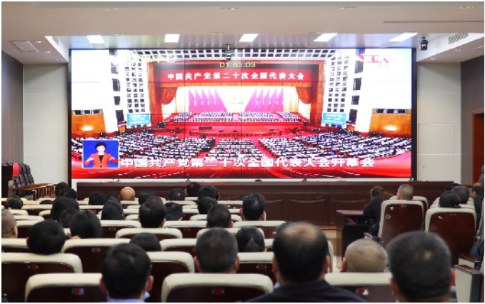
永州中院在职党员干部集中收听收看党的二十大开幕会。

经踏上了全面建设社会主义现代化国家、向第二个百年奋斗目标进军的新征程。新时代新征程,人民群众对民主、法治、公平、正义、安全、环境等日益增长的需求,对法治建设提出了新的更高要求。人民法院必须牢牢把握“坚持走中国特色社会主义道路”的重大原则,增强走中国特色社会主义法治道路的自信自觉,紧扣党的二十大关于坚持全面依法治国、推进法治中国建设的重大部署,持续深化司法体制综合配套改革,全面准确落实司法责任制,加快建设公正高效权威的社会主义司法制度。要围绕保障和促进社会公平正义,坚持严格公正司法,在坚持依法治国、依法执政、依法行政共同推进,法治国家、法治政府、法治社会