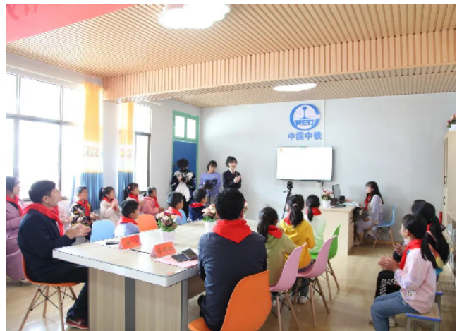
检察官与小学生互动交流。

本报讯(湖南法治报全媒体见习记者 刘建军 通讯员 张燕铭 李彦霏)为贯彻落实最高检关于“检爱同行,共护未来——法治进乡村”专项行动要求,进一步强化乡村地区未成年人法治意识和自我保护意识,加强对留守儿童、困境未成年人的关爱保护。近日,桂东县检察院联合团县委在10个乡镇同步开展了“检爱同行——法治进乡村”活动。