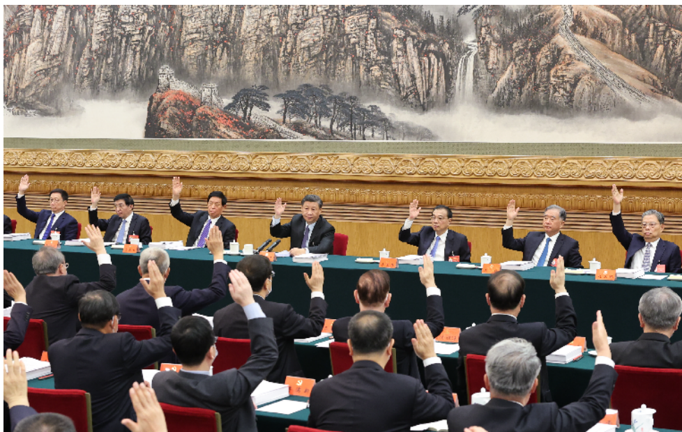
10月21日,中国共产党第二十次全国代表大会主席团在北京人民大会堂举行第三次会议。习近平、李克强、栗战书、汪洋、王沪宁、赵乐际、韩正等出席会议。