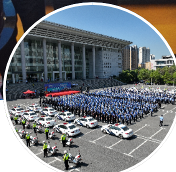
→岳阳市举行“护航二十大,忠诚保平安”安保维稳动员誓师大会。