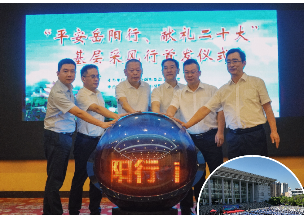
↑9月26日,“平安岳阳行·献礼二十大”基层采风行活动正式启动。

风雨兼程平安路,砥砺前行铸辉煌。在加快建设名副其实的省域副中心城市的新征程上,岳阳将始终牢记习近平总书记“落实好平安建设领导责任制,履行好维护一方稳定、守护一方平安的政治责任”的重要指示,以创建全国域社会治理现代化试点合格城市为目标,做到平安建设基础更牢、机制更优、措施更实、群众更满意,努力建设更高水平的平安岳阳,迎接党的二十大胜利召开。