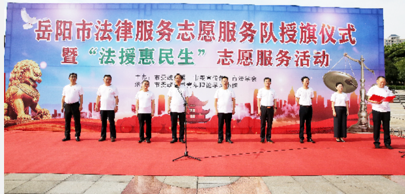
7月1日上午,在隆重庆祝中国共产党成立101周年之际,由市委政法委、市委宣传部、市法学会主办的岳阳市法律服务志愿服务队授旗仪式暨“法援惠民生”志愿服务活动在南湖广场举行。

案十万人发案数保持全省最少;全市1817个村(社区),“四无”村(社区)达797个。如今的岳阳,人民群众居家更加安心、出行更加放心、生活更加舒心,为岳阳实现高质量发展提供了坚强保障。