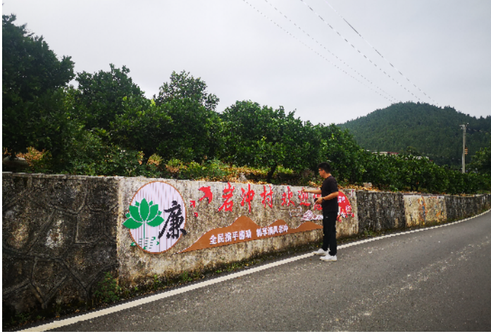
龙山县里耶镇岩冲村以勤廉家风文化为主基调，与脐橙产业景观构成一幅美丽的清廉乡村图画。

积极创作清廉文化艺术作品。广大党员干部群众在喜闻乐见的活动中受到清廉文化的熏陶。