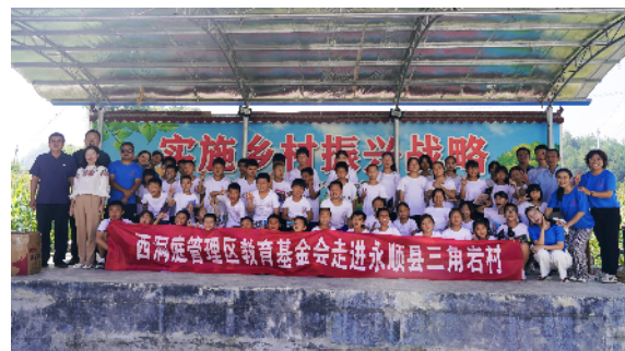
永顺县三角岩村支教点汇报演出结束后合影。

“民族振兴靠人才,人才振兴离不开教育,农业农村现代化是需要一代又一代人持续发力才能实现的。支教老师们的到来为山区孩子打开了一扇知识的窗,让他们了解山外世界的同时,也在心灵深处种下了爱的种子,这样的活动很有意义。”永顺县三角岩村乡村振兴工作队主要负责人表示。