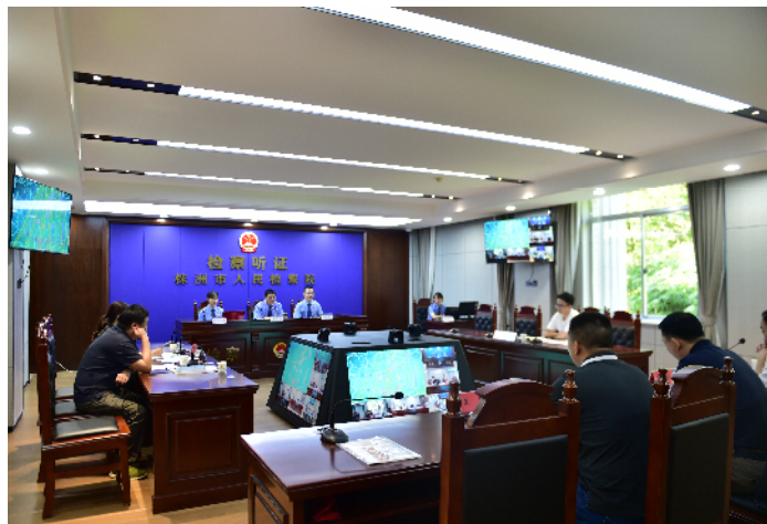
公益诉讼公开听证会现场。

察部副主任王亮介绍了基本案情,提出了需要听证的问题。行政机关参会代表就听证问题、行政职责和履职情况逐一进行说明。各听证员积极提问并发表意见建议。在充分了解案情后,4位听证员经集体讨论一致认为,株洲市部分餐饮店未遵守国家有关规定,使用不可降解一次性塑料吸管的情形损害了社会公共利益,相关职能部门存在未全面履职的情形。