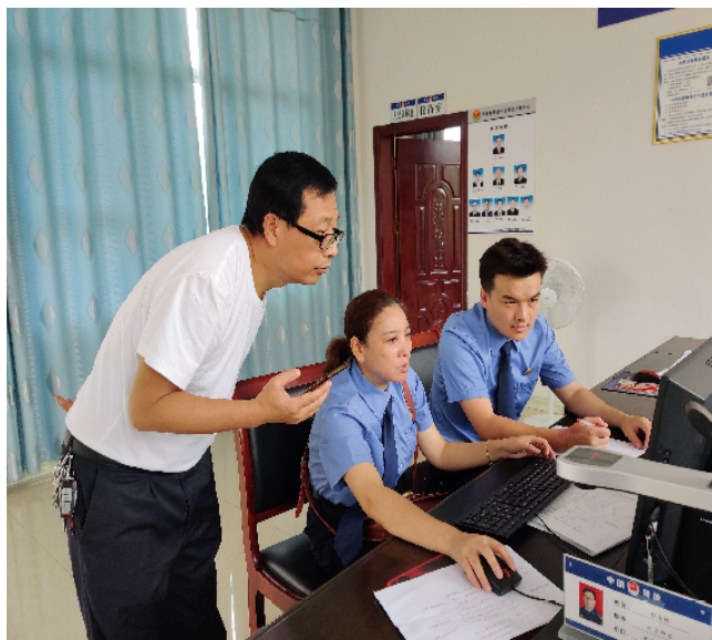
龙山县检察院联合县司法局对所辖街道乡镇司法所社区矫正工作开展检察监督。

此次联合检察监督活动增强了社区矫正工作人员的规范执法意识和责任意识,促进了社区矫正执法活动的规范开展,提升了社区矫正工作质效。下一步,龙山县检察院将继续强化刑事执行检察监督职能,持续促进社区矫正工作良性健康发展。