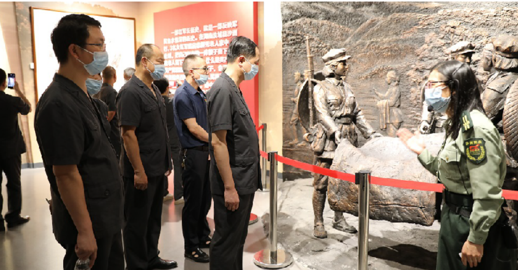
参观“半条被子的温暖”专题陈列馆。

本报讯（通讯员 赵大钧 胡雅丹）日前，新田县法院组织全院党员赴汝城县开展“庆七一·喜迎党的二十大”主题党日活动，接受红色精神洗礼。 在沙洲村广场上，30 余名党员庄严地举起右手，在党组