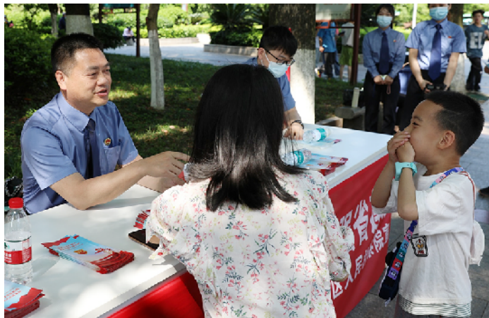
2022年4月24日,市检察院、北湖区检察院联合开展知识产权宣传周活动。

据悉,2021年3月被最高检确定为涉案企业合规改革试点单位后,郴州检察机关开始推进相关工作。市检察院成立