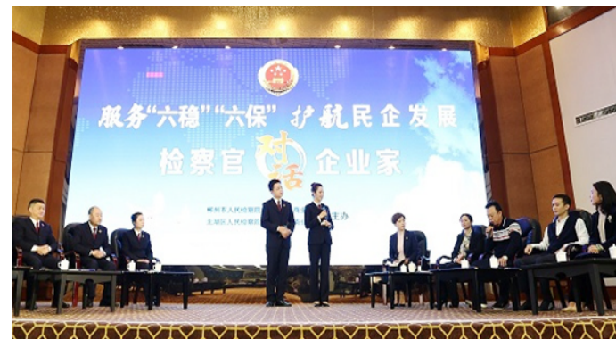
2020年10月30日,市检察院、市工商联与北湖区检察院、北湖区工商联共同举办“服务‘六稳’‘六保’护航民企发展”主题检察开放日。

近年来,起诉污染环境、非法捕捞水产品、非法采矿等破坏环境资源犯罪693人,办理生态环境和资源保护公益诉讼案件469件。针对中央环保督导组指出郴江河存在污水直排问题,市检察院发出诉前检察建议,相关职能部门大力支持、协同治理,促进投入整治资金9000万元。