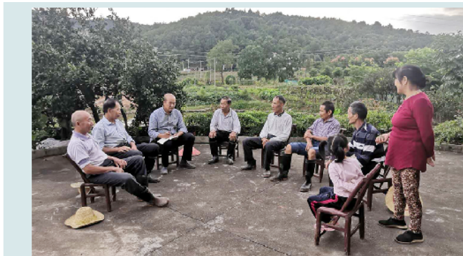
←浏阳屋场恳谈会化解基层矛盾纠纷。

坚持以最广大人民根本利益为坐标,创新社会治理,构建政府、社会、公众多方主体共同参与、共同行动、共享成果的新格局。抓实政法主责主业。深入