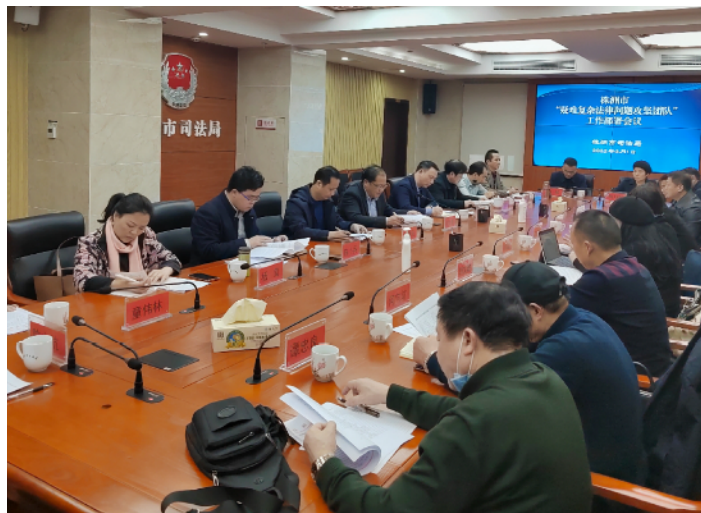
3月1日，市司法局召开“疑难复杂法律问题攻坚团”第一次工作部署会。

据了解，接下来，株洲市司法局将深入贯彻落实“法治护航十二条”，不断建立健全“法治护航”信息化服务平台，不断推动法治护航行动走深走实。一是聚焦源头服务，出好服务点子。有效发挥法律服务专家在服务“三高四新”战略中的积极作用，协助企业建立涉企决策咨询论证制度，落实重大决策合法性审查机制。二是聚焦营商环境，铺好服务路子。营造各类市场主体平等使用资源要素、公平公正参与竞争、同等受到法律保护的制度环境。三是聚焦企业需求，担好服务担子。组织法律服务专家参与研讨园区、企业涉法涉诉等疑难法律问题，统筹推进涉园区、企业的公共法律服务工作，努力为培育制造名城、建设幸福株洲作出应有贡献。