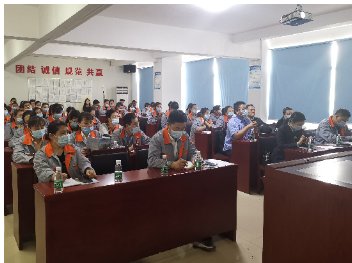
4月23日，市司法局到湖南益嘉瓷业有限公司开展法律服务。