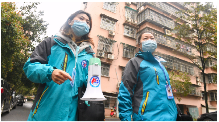
网格员走访入户宣传防疫知识。