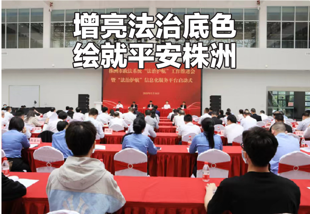
5月18日,株洲市举行政法系统“法治护航”工作推进会暨“法治护航”信息化服务平台启动仪式。

近年来,株洲市认真落实省委省政府决策部署,按照省委书记张庆伟提出的“深入推进平安建设、坚决守住重点领域安全底线”工作要求,以政治为引领、以平安为目标、以创新为动力、以法治为保障,奋力打造新时代“平安之城”,努力为“培育制造名城、建设幸福株洲”创造一流的法治环境、治安环境和营商环境。