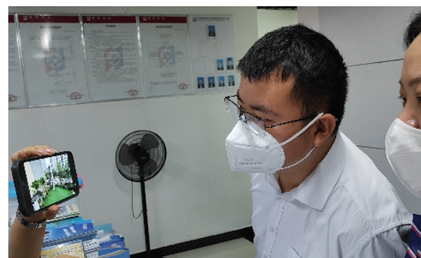
记者向物业公司相关负责人展示调查情况。