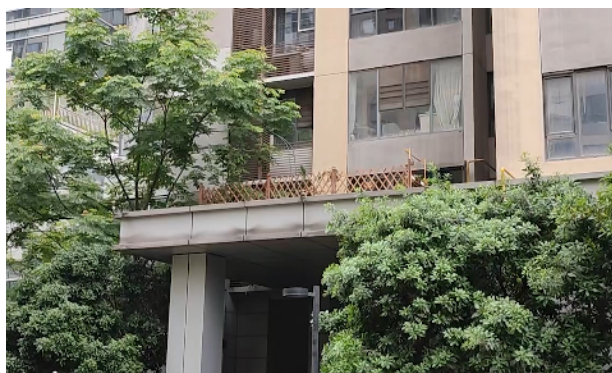
单元入户平台已经被改造成自习室一角。