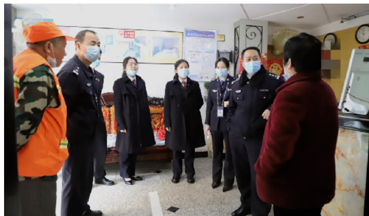
执法人员向宾馆经营人员询问有关情况。

根据《未成年人保护法》规定,旅馆、宾馆、酒店等住宿经营者接待未成年人入住或者接待未成年人和成年人共同入住时,应当询问父母或者其他监护人的联系方式、