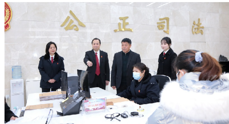
廖仁旺调研蓝山法院一站式建设服务情况。

本报讯(通讯员 晏斐斤)近日,全国人大代表廖仁旺应邀来到蓝山县法院,通过走访调研、座谈交流,详细了解法院一站式建设服务情况,他表示,法院一站式建设能有效化解当事人诉讼难。