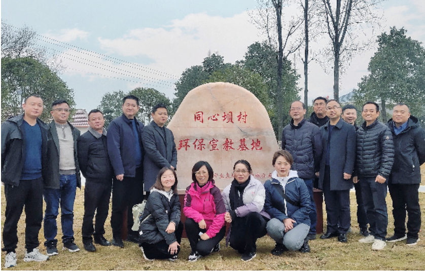
各单位代表在“环保宣教基地”合影留念。

“在同心坝村建设环保宣传基地，一是该村交通方便，离城区也近，周边辐射面广，利于学校和其他单位前来参观学