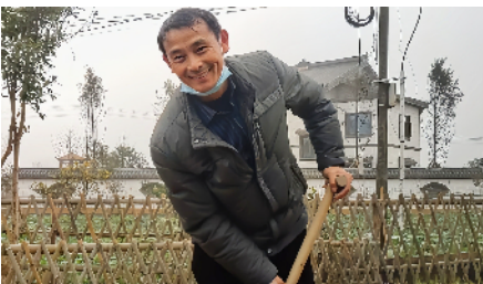
当地群众自发性对庭前院后环境进行日常维护。

本报讯（周芝华）1月12日上午，常德市生态环境局鼎城分局、鼎城区镇德桥镇等主要负责人一行，在镇德桥镇同心坝村和当地群众一起见证了同心坝村环保宣教基地揭牌仪式。据了解，该基地是常德市第1个村级环境保护宣传基地。