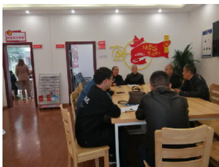
“五老”人员正在进行矛盾纠纷调解。

积极开展基层工作管理系统运用。为充分运用好湖南省司法行政基层工作管理新系统,制订了培训计划,结合农村